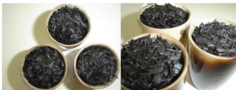
Figura 2. Amostras com biochar produzido a partir da palha de cana-de-açúcar

As análises de variância e o teste de Tukey, mostraram que os tratamentos diferem entre si, com 95% de confiança.