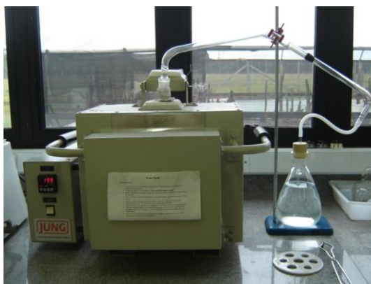
Figura 1. Mufla adaptada para captação de gases