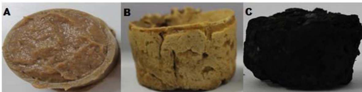
Figura 2. Massa de polpa da banana madura em molde cilíndrico de PVC (A); Briquete precursor seco (B); Briquete de carvão (C)

A metodologia aplicada para obtenção dos briquetes precursores fez os mesmos assumirem o formato ao qual foram moldados, no entanto, quando submetidos à secagem perderam umidade e na carbonização os demais compostos voláteis, e por consequência à redução do tamanho em volume. Com exceção dos briquetes elaborados com a polpa da banana verde, não houve desintegração dos blocos cilíndricos formados até o final do processamento (Figura 2).