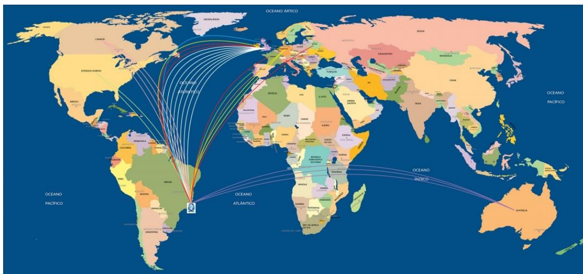
Figura 1. Descrição dos Países onde os estudantes do IQ/UFRJ realizaram seus intercâmbios no programa CsF

Essa adequação nem sempre foi simples, já que muitas universidades estrangeiras, participantes do CsF, não apresentavam o mesmo grau de empenho e organização na administração do programa. Como exemplo podemos citar a Universidade alemã Eberhard Karls Universität, em Tübingen, que não definiu um coordenador na área de química, gerando dificuldades para o bom desempenho dos alunos que realizaram seu intercâmbio nessa universidade, independentemente da qualidade da mesma. Por outro lado, na Universidade francesa UPEC 12, de Paris, o coordenador da área de Química sempre era muito solícito para realizar alterações dos programas de estudos dos alunos, com a permissão e conhecimento do coordenador do curso do IQ. Esse canal de comunicação entre os coordenadores brasileiro e francês foi extremamente importante para o bom desempenho do aluno. Todas as demais universidades escolhidas pelos estudantes do IQ/UFRJ também contaram com a participação de coordenadores dispostos a auxiliar os alunos durante o período de permanência em suas universidades. A Figura 1 apresenta a descrição dos locais em que os estudantes do IQ/UFRJ realizaram seus intercâmbios no programa CsF.