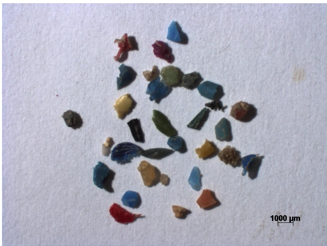
Figura 4. Microplásticos coletados em águas superficiais da Baía de Guanabara-RJ. Fonte: Olivatto 79

As sacolas de supermercados fabricadas a partir dos plásticos oxo-biodegradáveis, também podem ser materiais em potencial para a geração de microplásticos secundários no meio ambiente. Na síntese desses polímeros são adicionados aditivos químicos degradantes, geralmente compostos de metais de transição, que atuam na catálise da degradação oxidativa do material na presença de luz e calor. No entanto, os fragmentos resultantes desse processo não sofrem uma conseqüente redução da massa molar na presença de microrganismos, ou seja, a biodegradação a partir dos fragmentos não é acelerada. 27 Portanto, o plástico oxo-biodegradável além de contribuir com a geração dos microplásticos, materiais que em comparação aos macroplásticos são mais difíceis de serem retirados do ambiente, devido à maior dificuldade de identificação dessas partículas, ainda contribui com a