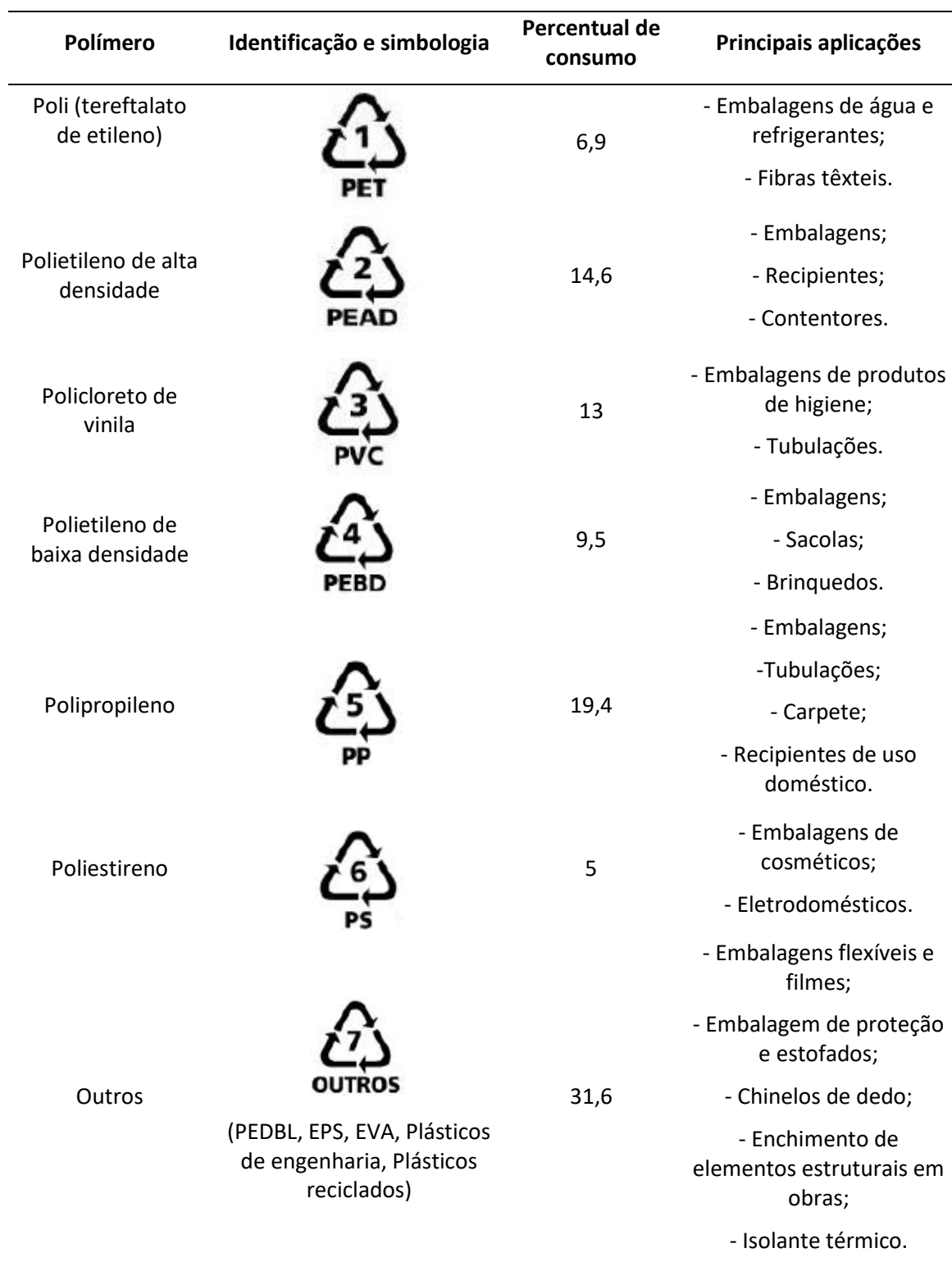
Tabela 1. Principais polímeros, percentual de consumo e principais aplicações