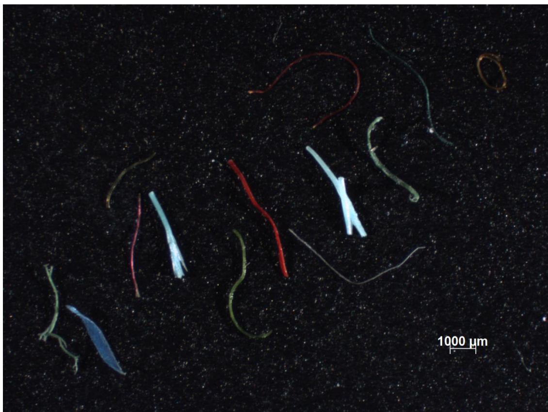
Figura 3. Microplásticos fibras coletados em águas superficiais da Baía de Guanabara-RJ.